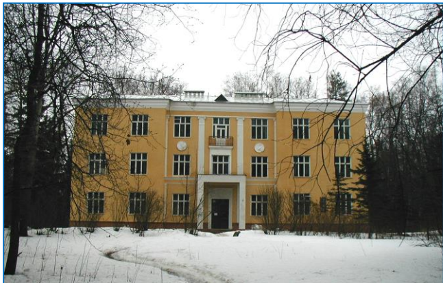
Корпуса Института расположены в живописном парке

Институт биологии внутренних вод им. И. Д. Папанина РАН (ИБВВ РАН) берёт своё начало с 1932 г., когда почётный академик Н. А. Морозов передал Академии наук СССР часть своей усадьбы «Борок». В 1938 г. здесь была