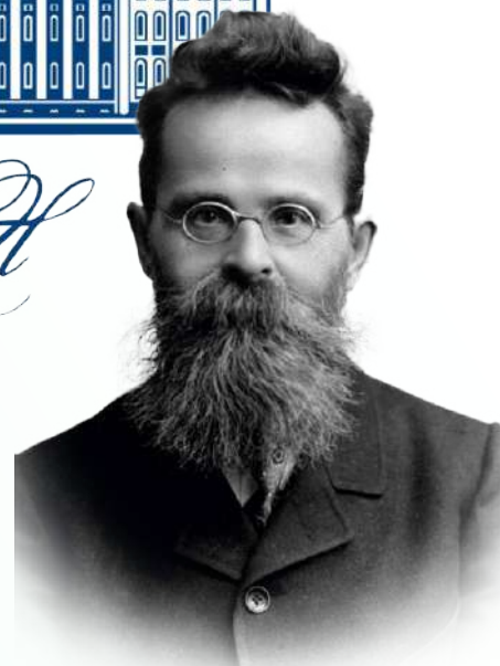
Морозов Николай Александрович (1854–1946)

ИНСТИТУТ БИОЛОГИИ ВНУТРЕННИХ ВОД им. И.Д. ПАПАНИНА (ИБВВ РАН)