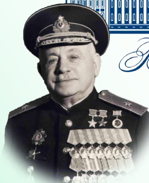
Папанин Иван Дмитриевич (1894–1986)