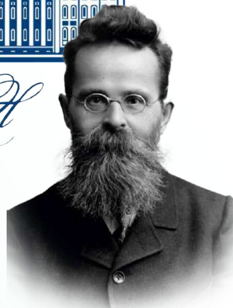
Морозов Николай Александрович (1854–1946)